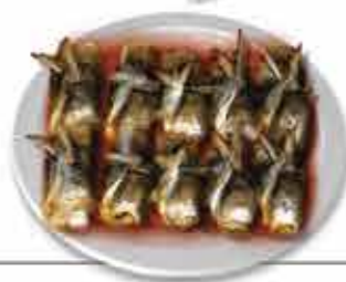
Sardinhas de Rabo ao Alto Do mar de Ancora

Degustar as variadíssimas iguarias do concelho de Caminha é entrelaçar-se na cultura, nos hábitos e costumes das populações, e perder-se nos seus sabores de mar e terra.