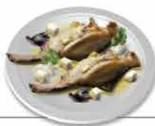
Solhas Secas "à moda de Lanhelas" Afamadas pela sua frescura e confeção