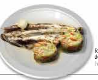
Robalo Escalado do Mar da Insua Pescado "à linha"