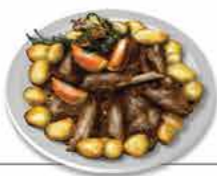
Cabrito à Moda de Serra d'Arga Fruto da agricultura Serrana