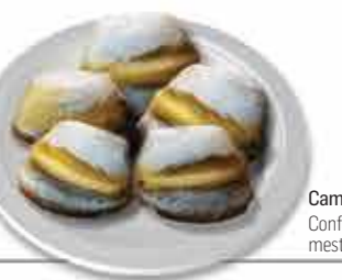
Caminhenses Confeccionados com mestria e tradição