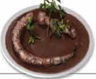
Lampreia do rio Minho Um prato de Excelência