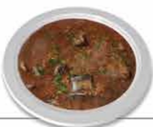
Lampreia do Rio Minho Sabores seculares de tantas formas