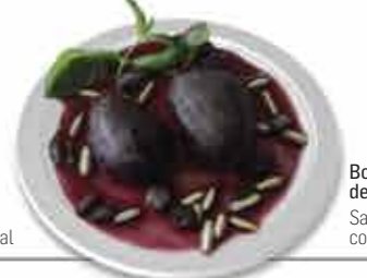
Borrachinhos de Valença Sabores da doçaria conventual