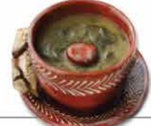
Caldo Verde 1 das 7 Maravilhas gastronómicas de Portugal