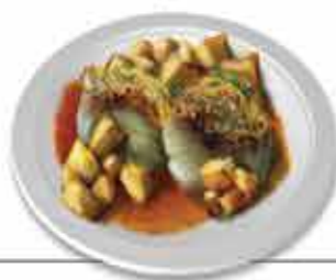
Bacalhau à S. Teotónio Bacalhau em tapas ou de mil maneiras

A Eurocidade, a fronteira e a fortaleza de valor mundial, o comércio tradicional, o verde do Minho e séculos a apurar o gosto e as receitas, fazem de Valença destino gastronómico privilegiado, premiado com uma das 7 maravilhas da gastronomia portuguesa.