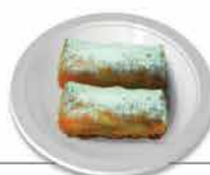
Valencianos Doce pecado