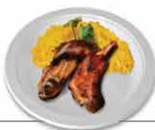
Anho e Cabrito Preparado em fornos a lenha