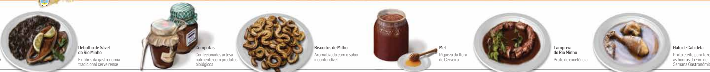
Debulho de Sável do Rio Minho Ex-libris da gastronomia tradicional cervense

A gastronomia típica de Vila Nova de Cerveira esteve sempre associada ao cultivo da terra e às atividades piscatórias do rio Minho. Do debulho do sável ao galo de cabidela, razões não faltam para os diversos apreciadores de gastronomia de excelência